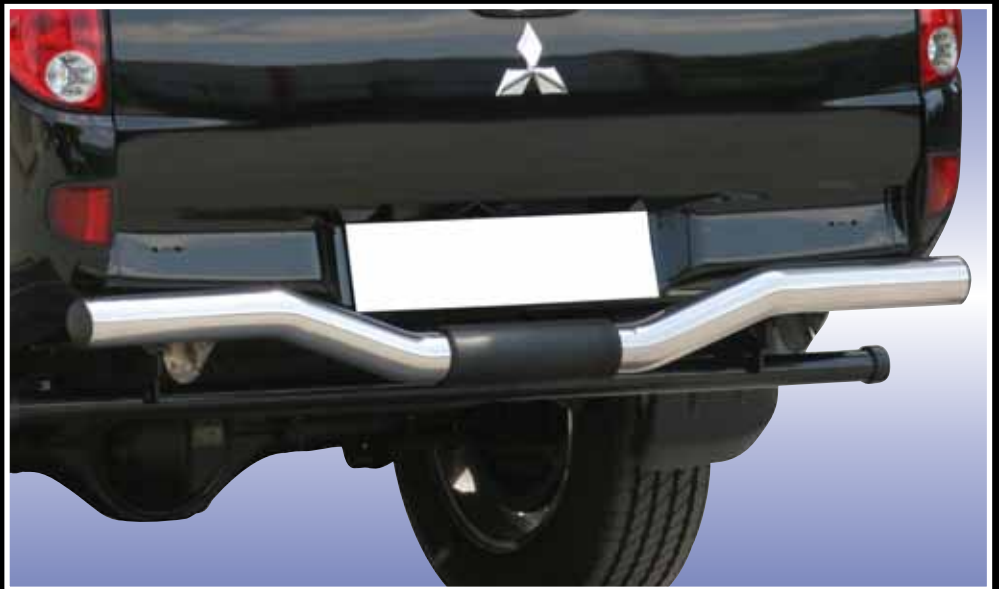
PARE-CHOC ARRIERE DOUBLE TUBE INOX Ø 63