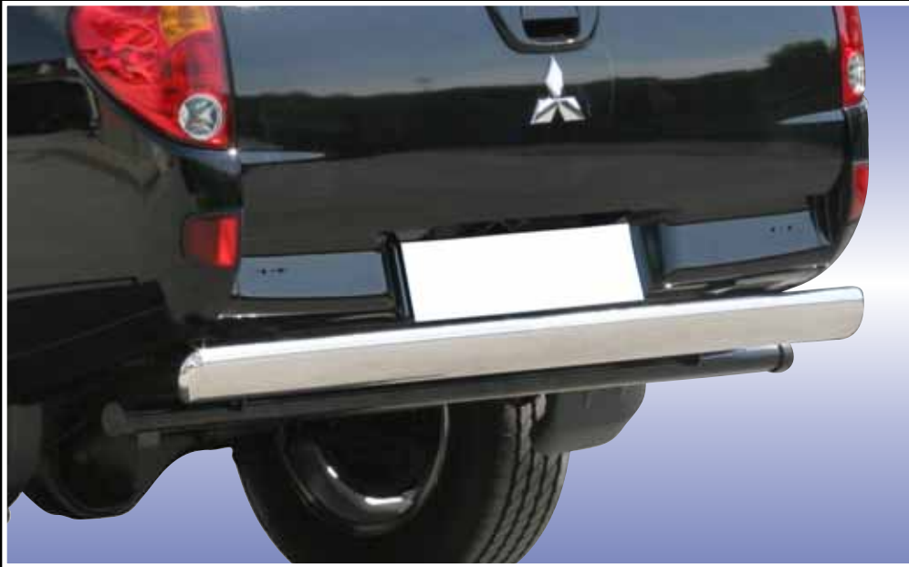
PARE CHOCS ARRIERE OVALE