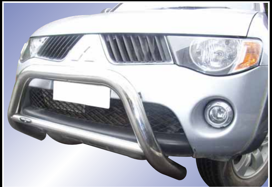
SUPER BAR INOX Ø 76