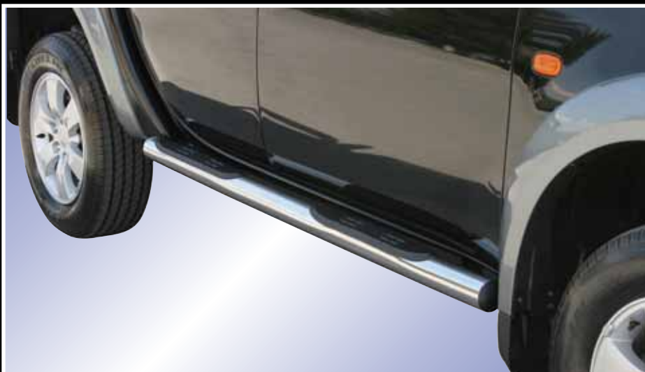
TUBES MARCHE-PIEDS INOX Ø 76