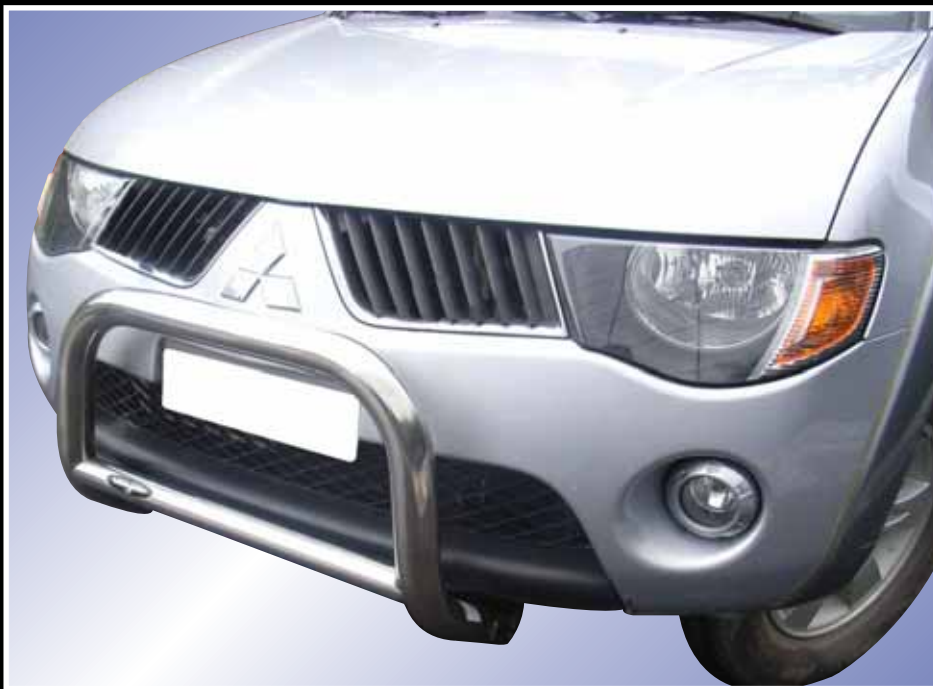
SMALL BAR INOX Ø 63